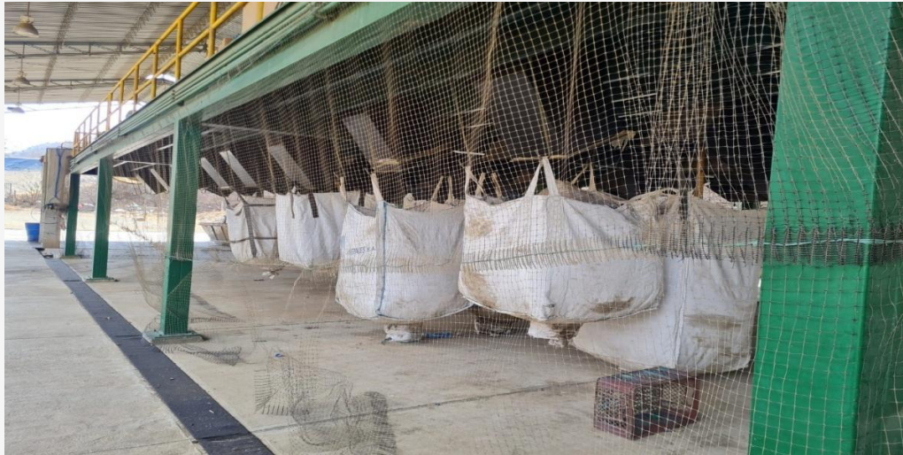
BIG -BAGS DE MATERIAL YA CLASIFICADO PESO PROM (300 KGS)