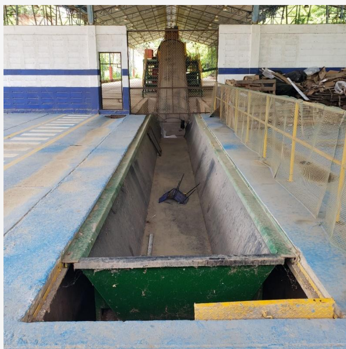
ZONA DE DESCARGA DE RESIDUOS SOLIDOS URBANOS FASE 1

Si usted tiene alguna pregunta sobre esta cotización, por favor, comunicarse